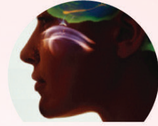
비염, 부비동염, 위식도 역류 등의 질환