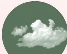
흡입성 자극물질 대기오염, 찬 공기, 자극성 가스, 기후변화