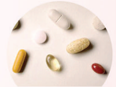
약물 베타차단제, 비스테로이드성 진통소염제