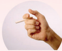
담배연기 (직접 및 간접 흡연)