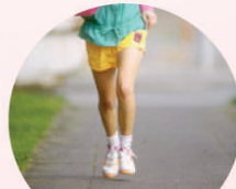
운동 및 과도호흡