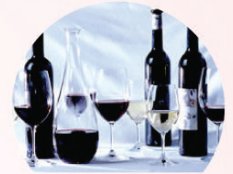
음식 아황산염 함유음식